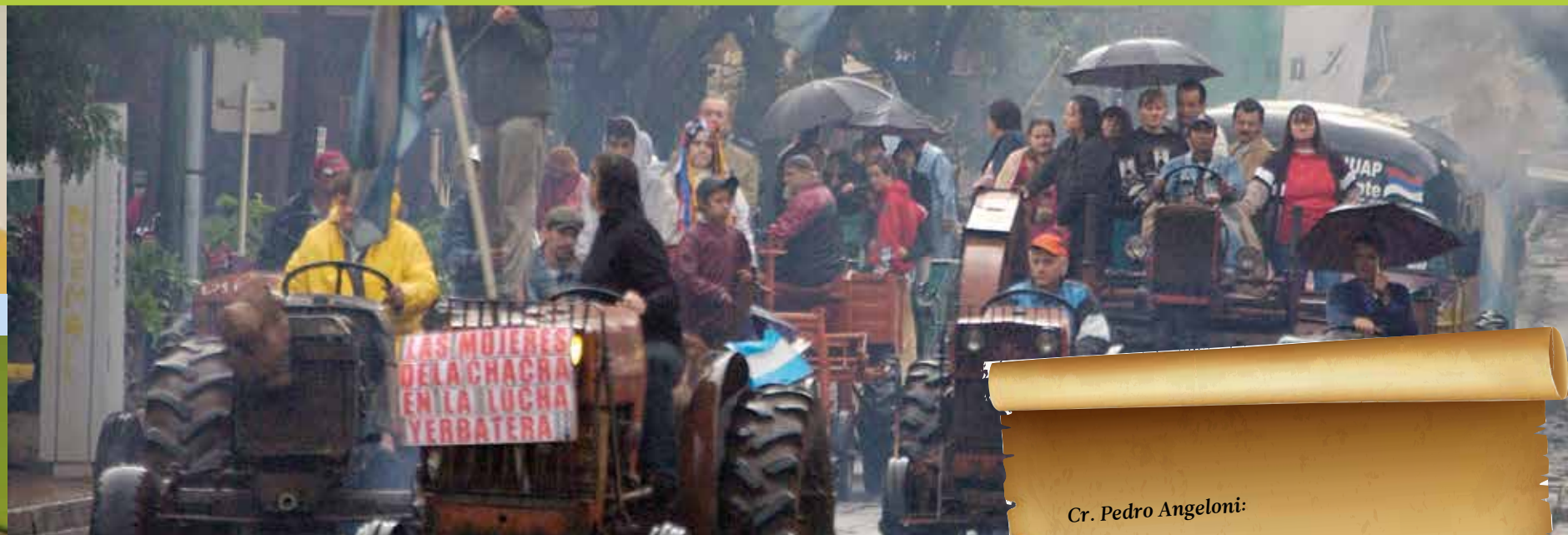
En mayo de 2012, el "tractorazo" movilizó hasta Posadas a productores del interior

na que el café, y no sabíamos nada más. Hoy, vos vas a vender al exterior, le llevás los estudios científicos de qué tiene la yerba y sus propiedades y se te abren todas las puertas".