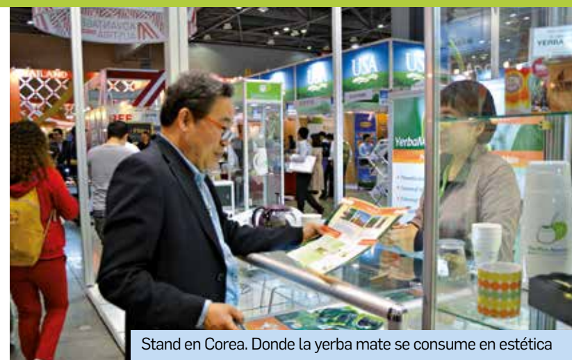
Stand en Corea. Donde la yerba mate se consume en estética

Más cerca de la Argentina, el INYM eligió formar parte este año de eventos que organizan los países vecinos