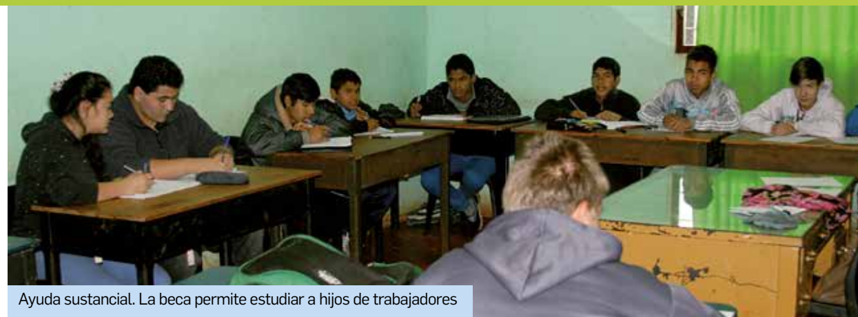
Ayuda sustancial. La beca permite estudiar a hijos de trabajadores