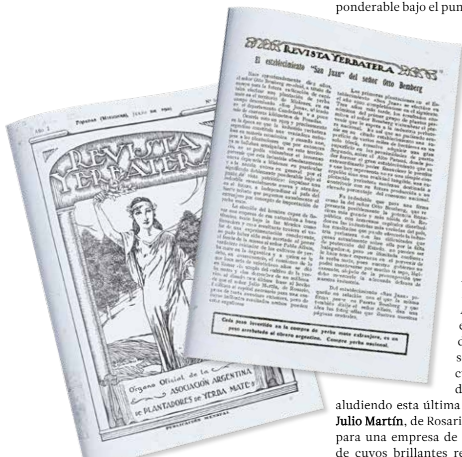
Revista Yerbatera Nro 8, julio de 1929