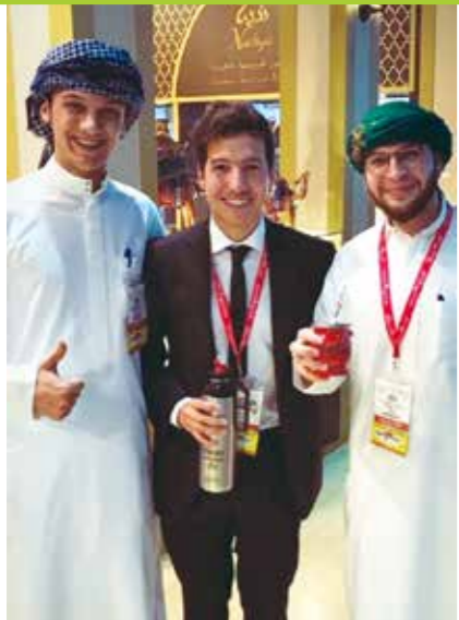
Puerta: buscamos abrir nuevos mercados