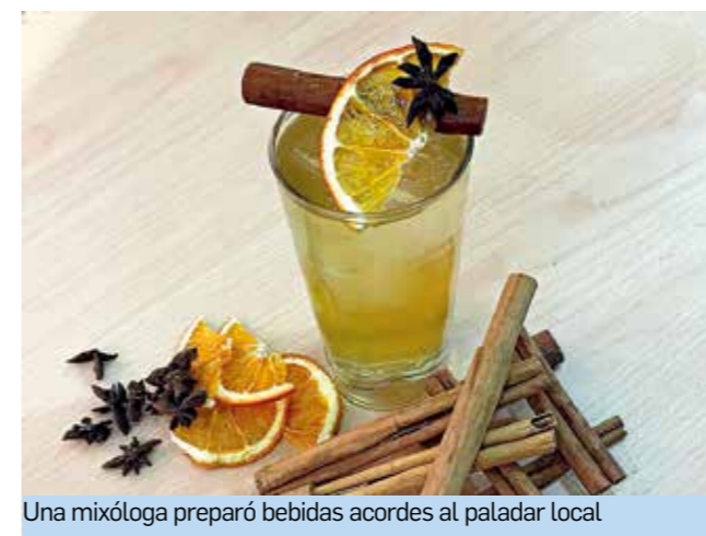
Una mixóloga preparó bebidas acordes al paladar local