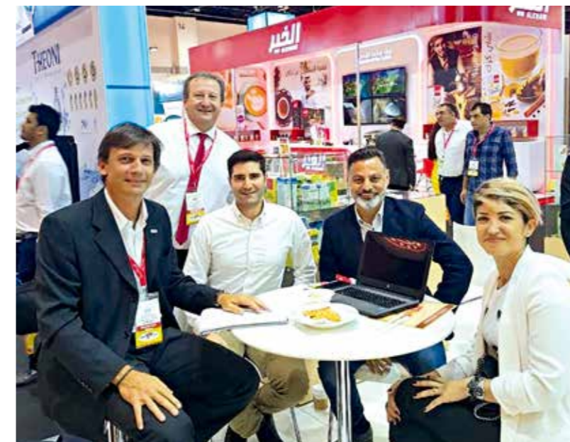
Representantes de la firma Piporé agradecieron la invitación