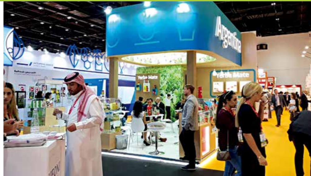
El INYM participó en la Gulfood 2018 con su equipo de promoción y empresarios