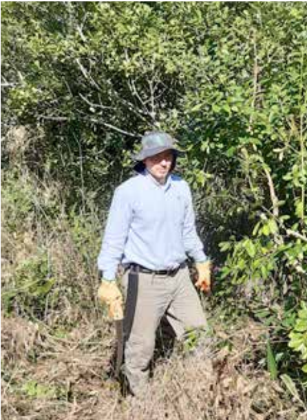
Correcto, uso de sombrero con alas.