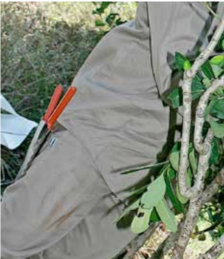
Tijera con funda

Los Riesgos y las Buenas Prácticas se detallarán en el bloque siguiente.