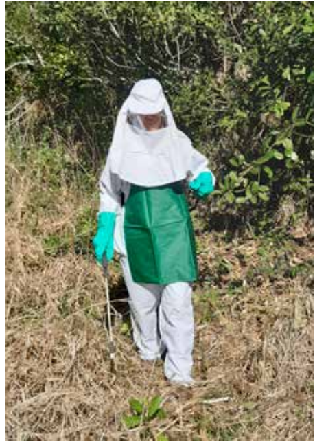
Traje apto para productos químicos (EPP)