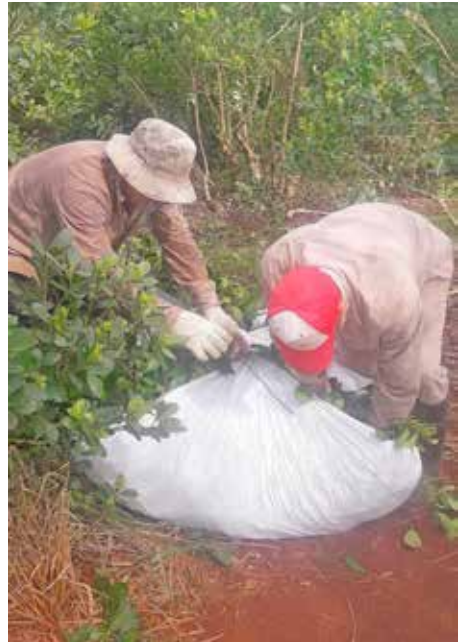
Armado de raído

Es de buena práctica el uso de carros/ carretillas para transportar los raídos hasta el pie del camión, ya que superan los 50kg. Se recomienda manipular los raídos entre varios trabajadores.