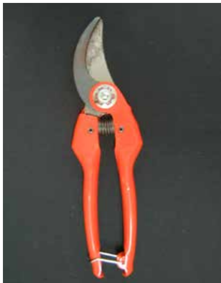
Tijeras de mano