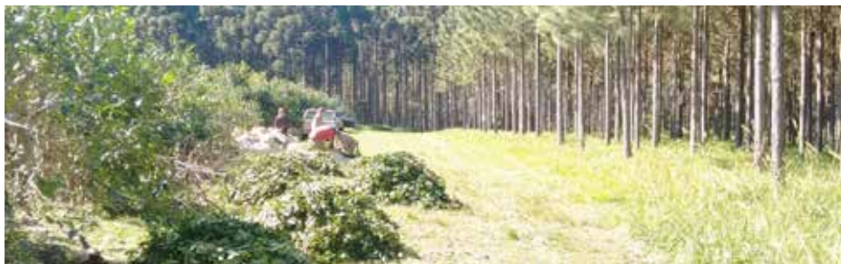
Cosecha al pie de la plantación.

ARTÍCULO N°48: Extracción de raídos. La extracción de raídos de los líneas de las plantaciones de yerba, se hará únicamente con medios que reduzcan considerablemente el esfuerzo físico de los trabajadores. Queda expresamente prohibida la extracción de raídos de yerba mate en hoja verde, ya sea en forma manual o sobre la espalda u hombro de los trabajadores que se desempeñen en las tareas de cosecha de yerba mate.