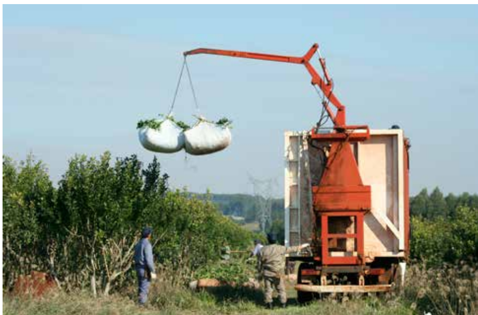
Camión con guinche