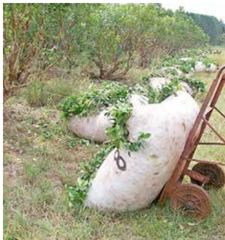
Traslado de raídos con carros