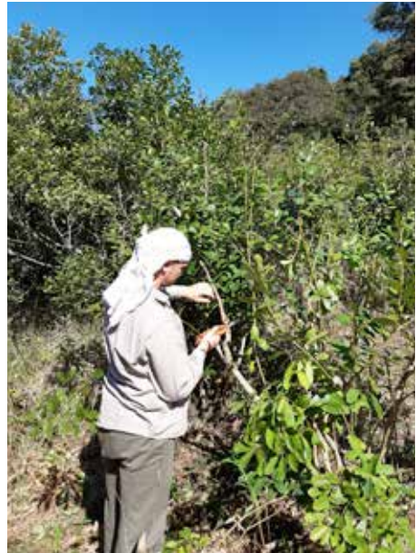
Incorrecto, uso de prendas atadas.