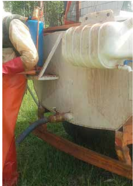
Soporte para carga de mochila